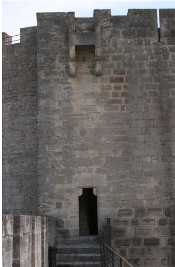
Les bretèches défendent les accès des tours sur la courtine