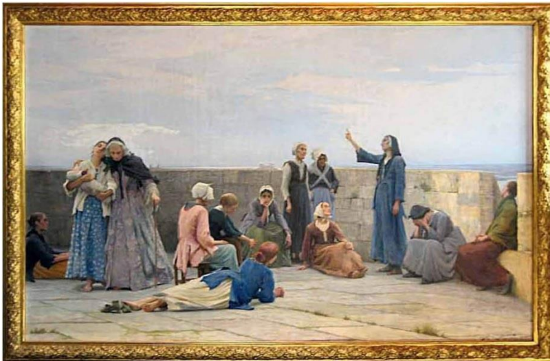
« Prisonnières huguenotes à la tour de Constance d'Aigues Mortes », un tableau de Michel Maximilien Leenhart, d'après une copie offerte au monument d'Aigues-Mortes par les descendantes du pasteur Monod

Cet étage a connu une utilisation plus dramatique. C'est dans cet espace restreint que furent incarcérés au XVII e et au XVIII e siècles des protestants pour fait de religion, d'abord des hommes, puis, après l'évasion spectaculaire d'Abraham Mazel, des femmes.