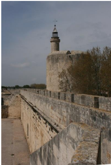
La tour de Constance depuis le chemin militaire

Le premier édifice achevé par Louis IX est la tour-donjon qui défend l'ensemble castral. Avec ses 30 m de haut pour un diamètre de 22 m, elle est caractéristique de l'architecture royale depuis le règne de Philippe Auguste. La masse de pierre repose sur un réseau de pilotis qui ameublit le sol sablonneux.