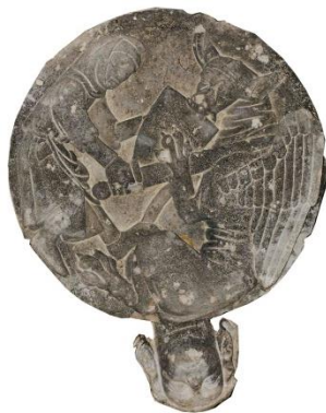
Une clef de voûte ornée dans la tour du Sel

Malheureusement, Louis IX, qui meurt en croisade à Tunis en 1270, n'a pas eu le temps de voir aboutir son projet. Les travaux de l'enceinte débutent deux ans après la mort du roi. Philippe III le Hardi confie la tâche au Génois Guillaume Boccanegra, qui se charge de la construction contre la perception de la taxe du port. Mais Boccanegra meurt en 1274, alors que les travaux sont à peine commencés, et ses héritiers renoncent à poursuivre l'œuvre de leur père. En 1278, Philippe III ajoute aux travaux de l'enceinte la construction d'un quai de pierre le long du chenal qu'il fait percer au regard de la ville, désigné aujourd'hui sous le nom de La Peyrade, dans le but de réduire la distance entre le lieu d'ancrage des navires de haute mer et la cité. Les travaux se poursuivent lentement et Aigues-Mortes est encore une ville ouverte lorsque les vaisseaux de l'amiral catalan Roger de Lluria viennent attaquer le port en 1285 et s'emparer des navires à l'ancre et de leurs marchandises. C'est sans doute ce douloureux épisode qui accélère l'entreprise. En 1289, un rapport adressé au sénéchal de Beaucaire révèle qu'il reste encore à faire 1580 cannes carrées de courtines (environ 650 m, soit l'équivalent des courtines