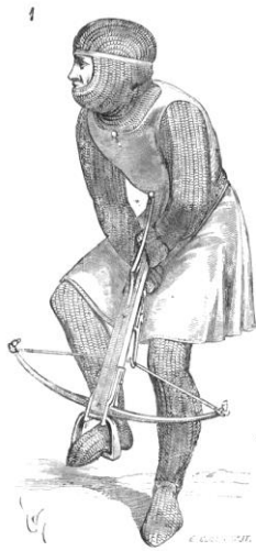
Un arbalétrier, selon Viollet Le Duc, Dictionnaire raisonné du mobilier français de l'époque carlovingienne à la Renaissance. T. 5 (s.d.), p. 22.

Bien qu'aménagé à plusieurs reprises en fonction de l'évolution de l'armement et des techniques de guerre, le monument d'Aigues-Mortes présente un exemple parfait pour s'initier à l'architecture militaire médiévale, en découvrir le vocabulaire et comprendre les techniques de défense utilisées par les défenseurs de la ville. Même si les superstructures de bois et de tuile ont disparu, on peut, en cheminant sur la courtine et au travers des différents ouvrages se familiariser avec les éléments architecturaux de défenses extérieurs, comme les archères, les chambres de tir, les assommoirs, les créneaux et les merlons, les ouvertures supportant les hourds,... et avec ceux que l'on doit rattacher à la défense des courtines elles-mêmes, les bretèches par exemple, le système des escaliers intérieurs et extérieurs.