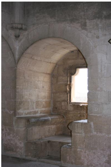
Un chambre de tir, côté ville